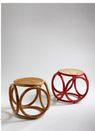
dizajn Valentin Puzak, 1965., vl. M. Marčić

Povijest tog pogona, dakle, seže na sam kraj 19. stoljeća. Budući da je nakon isteka patenta tvrtki Gebrüder Thonet 1869. otvorena mogućnost osnivanja tvornica te vrste diljem Austro-Ugarske Monarhije u područjima bogatim osnovnom sirovinom, bukovom šumom, one se počinju osnivati i u Hrvatskoj, i to većinom ulaganjem stranog kapitala. Primjerice, u Gorskom kotaru francuska tvrtka Charlesa Chevalliera (kasnije Chevallier Frères ) osniva 1880-ih tvornicu u Vratima kod Fužina, dok u Osijeku još od 1865. djeluje tvornica Rudolf Kaiser . 2 Pogoni ove vrste počeli su raditi i u okolici Varaždina: Bačić i Kopaitić u Drenovcu kraj Varaždinskih Toplica, te u Slanju kraj Ludbrega tvornica koju je osnovao Charles (Karl, Dragutin) Aleksandar Lambert, francuski grof, izumitelj i pionir svjetskog zrakoplovstva nakon što je ondje kupio imanje 1894. godine. Obje će otvoriti svoje podružnice u Varaždinu ( Bačić i Kopaitić 1893.; Lambert 1900./1901.), no prva će napustiti proizvodnju pokušava vrativši se primarnoj djelatnosti parne pilane (1896.), dok će Lambert otvoriti tvornicu u Dugoj (Zagrebačkoj) ulici 27 (1902.) gdje će se proizvoditi namještaj sve do izgradnje nove tvornice 1955. godine. Tvornica će biti u vlasništvu Lamberta do 1906. kada je na kratko vrijeme kupuje Una d.d. za industriju drva , da bi je u