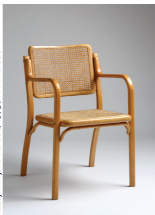
dizajn Mirjana Marčić, 1975., vl. M. Marčić

Povijest tvornice bila je uglavnom predmet istraživanja povjesničara i istraživača pojedine regije u okviru ekonomske povijesti. 4 Uzrok zapostavljanja od strane povjesničara dizajna, primjerice u teoriji i kritici 1960-ih i 1970-ih, leži u već poznatoj diskrepanciji između realnosti postojanja ogromnog industrijskog pogona i produkcije te paralelnog očekivanja subjekata teorije i povijesti umjetnosti koji su zahtijevali visoku kvalitativnu razinu domaće proizvodnje (što je pozitivno) i u skladu s tim mahom su isticali, uz autorske osobnosti, primjere tvornica koje su imale izraziti dizajnerski pečat i