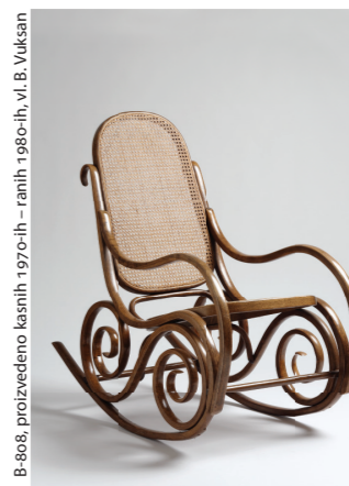
B-808, proizvedeno kasnih 1970-ih – ranih 1980-ih, vl. B. Vuksan

Florijan Bobić najviše je izvezio putem Exportdrva kao centralne republičke organizacije osnovane 1948. godine, ali i putem drugih organizacija tog profila. 9 Exportdrvo je osiguravalo sirovinu i izvedbu koju povjerava određenoj tvornici, čime rukovodi Tehnički ured u kojem su izrađivani i izvedbeni nacrti. 10 O tome svjedoče sačuvani nacrti Tehničkog ureda Exportdrva za naslonjač, stol i ugaonu klupu (s dvije varijante nosača) namijenjeni za izradu u tvornici Florijan Bobić , a