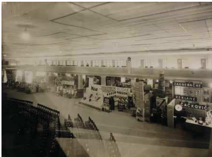
4 Foto Donegani, Postav Izložbe reklame – Donja galerija s komercijalnim izlagačima, 1934., fotografija, Državni arhiv u Zagrebu, HR DAZG–251–8, kut. 175

Foto Donegani, Advertising Exhibition setup – Lower Gallery with the commercial exhibitors' areas, 1934