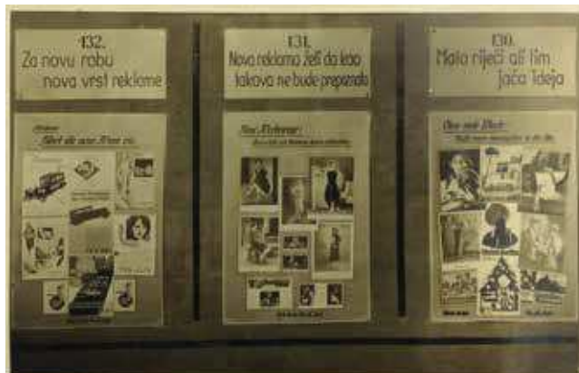
2 Foto Donegani, Ploče na Izložbi reklame s građom iz Lachova arhiva, 1934., fotografija, Državni arhiv u Zagrebu, HR DAZG–251–8, kut. 175 Foto Donegani, Boards displaying exhibits from Lach's archives at the Advertising Exhibition, 1934