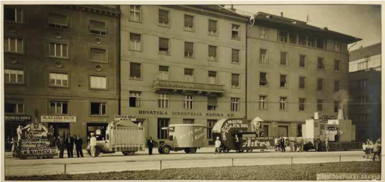
6 Foto Donegani, Reklamni korzo, 1934., fotografija, Državni arhiv u Zagrebu, HR DAZG–251–8, kut. 174 Foto Donegani, Advertising motorcade, 1934

ljenog u časopisu Cinema može redatirati u 1932. godinu. 56 Suradnici Ateliera Tri na plakatu spajaju estetiku avangarde s elegancijom art décoa, 57 a njihovo moderno rješenje dobro korespondira s Kodakovom tradicijom. Naime, popularna ikona tvrtke, tzv. Kodak djevojka ( Kodak Girl ), transformirana je u suvremenu protagonisticu velegrada, profinjenu damu s bubikopf frizurou odjevenu po posljednjoj modi. Tvrtka Kodak je od samih početaka bila svjesna važnosti oglašavanja, a glavna zvijezda njezinih reklama od 1880-ih bila je privlačna, samostalna i moderno odjevena mlada djevojka koja je uspješno baratala fotografskom opremom i demonstrirala poželjan životni standard te čija se medijska pojavnost mijenjala paralelno s promjenama poimanja ženskoga identiteta. 58 U skladu s aktualnim inozemnim trendovima, Atelier Tri je simpatičnu djevojku zamijenio »novom ženom«, elegantnom ikonom stila koja je u međuratnom razdoblju utjelovila nove slobode i demonstrirala novopronađenu samosvijest, a koja na plakatu spretno barata fotoaparatom potvrđujući navedenu misao da je »fotografiranje prekrasan sport za svakoga uz to jednostavan i jeftin sa Kodak proizvodima«.