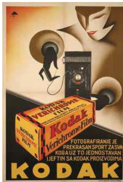
5 Atelier Tri, Plakat za Kodak, 1932., litografija, Muzej za umjetnost i obrt, Zagreb, inv. br. MUO-23352

Foto Donegani, Advertising Exhibition setup – Lower Gallery with the commercial exhibitors' areas, 1934