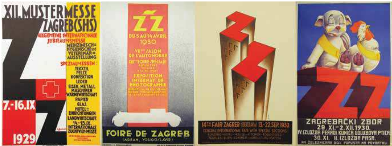
3 Plakati Zagrebačkog zbora od Sergija Glumca, Vladimira Miroslavljevića, Božidara Kocmuta i Kornela Becića, 1929. – 1930., Državni arhiv u Zagrebu, HR DAZG–251–8

Posters for Zagreb Fair by Sergije Glumac, Vladimir Miroslavljević, Božidar Kocmut, and Kornel Becić, 1929–1930