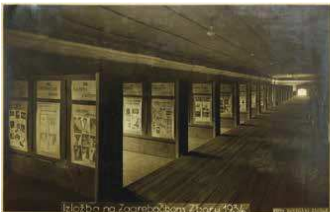
1 Foto Donegani, Postav Izložbe reklame – Gornja galerija, 1934., fotografija, Državni arhiv u Zagrebu, HR DAZG–251–8, kut. 175 Foto Donegani, Advertising Exhibition setup – Upper Gallery, 1934