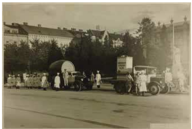
7 Foto Donegani, Prva hrvatska tvornica ulja na reklamnom korzu, 1934., fotografija, Državni arhiv u Zagrebu, HR DAZG–251–8, kut. 175 Foto Donegani, The First Croatian Oil Factory at the advertising motorcade, 1934

braća Mirosavljević i Božidar Kocmut, Emil Vičić i drugi. 61 Nekoliko sačuvanih snimaka reklamnog korza pokazuje domišljata rješenja pojedinih tvrtki među kojima su se isticala ambiciozne trodimenzionalne konstrukcije poput makete zgrade u Ilici u kojoj se nalazila popularna robna kuća Kastner & Öhler (današnja Nama) (sl. 6). Dok je za većinu vozila teško utvrditi autore rješenja, predstavljanje Prve hrvatske tvornice ulja s uvećanom kantom ulja vjerojatno je koordinirao Sergije Glumac koji je u međuratnom razdoblju radio kao reklamni stručnjak tvornice, oblikovao njezina izložbena mjesta na ZZ-u i cjelokupan vizualni identitet te kreirao moderan i popularan image »najfinijeg stolnog ulja« Crvena zvijezda (sl. 7, 8). 62